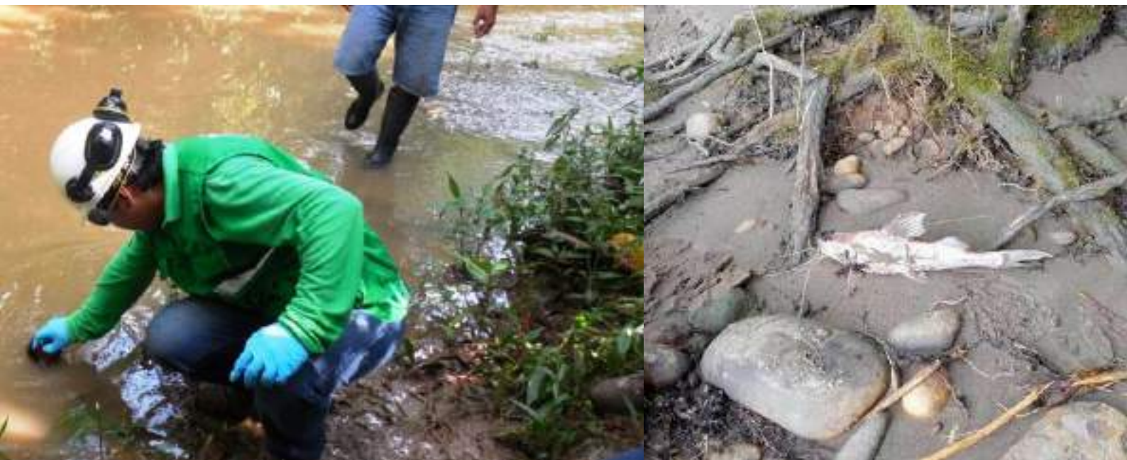
PÁG. 17: Radio Quillabamba (Izq.) Mongabay (Der.)

Es importante considerar que a la fecha nuestro país está inmerso en la elaboración de un Plan Nacional de Acción sobre Empresas y Derechos Humanos cuyo plazo de culminación se espera sea fines del 2019. Por lo antes mencionado, creemos imperativo que haya una participación efectiva de los pueblos indígenas y de la sociedad civil en la elaboración del diagnóstico y línea base que servirá para la elaboración de dicho Plan pues no solo se ven afectados sus derechos a la vida y a