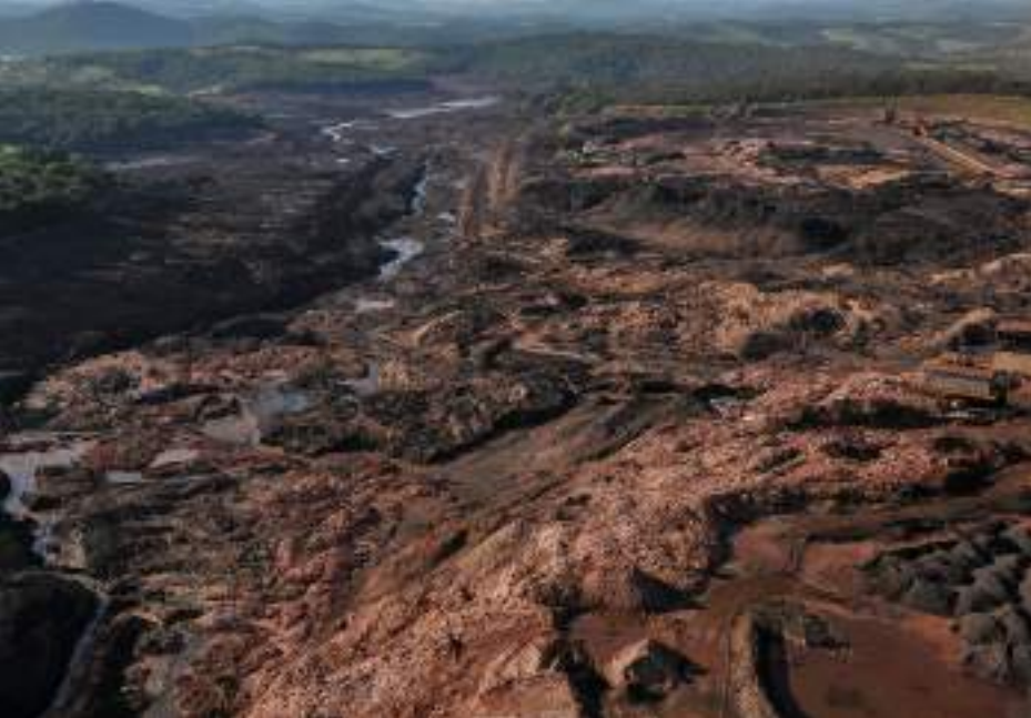
PÁG. 15: Agencia Brasil (Arriba) y Flickr (Abajo)