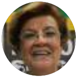
Comisionada Esmeralda Arosemena de Troitiño

¿Cuáles son los principales obstáculos que identifican en cuanto al acceso a la justicia e igualmente cuáles serían los principales desafíos y oportunidades en materia de reparación existentes en la región?