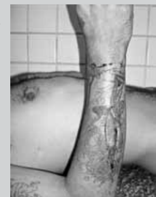
Preso com ferimento no braço DPJ de Cariacica - fevereiro/2010

O Departamento de Polícia Judiciária (DPJ) de Cariacica foi visitado no final da tarde de 3 de fevereiro de 2010. Trata-se de uma delegacia de polícia com uma diminuta cela de passagem em suas dependências. No momento da visita, havia seis homens presos nessa cela, cujo tamanho não era superior a quatro metros quadrados. Como não cabiam nesse espaço, alguns estavam em redes improvisadas com lençóis ou pendurados nas grades. Um dos corredores da delegacia havia sido convertido em cela. Lá, havia ao menos doze homens algemados uns aos outros pelos tornozelos. O espaço não era suficiente para que se deitassem ou ficassem em qualquer posição confortável. Não tinham acesso a banheiro ou água sem a interferência dos policiais, que executavam o papel de carcereiros sem qualquer condição para isso.