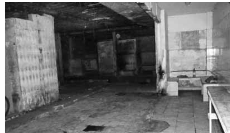
Local onde havia cela superlotada. Delegacia de Polícia Judiciária de Vila Velha – abril/2011