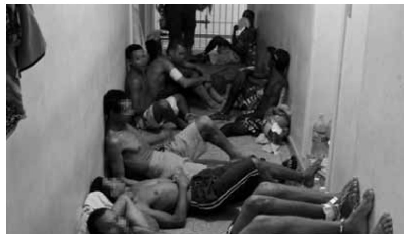
Presos alojados no corredor por falta de espaço nas celas. Departamento de Polícia Judiciária de Cariacica - fevereiro/2010