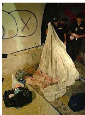
(Operação de recolhimento na Lapa)

Relatos de Educadores Sociais das Instituições da Rede Rio Criança e das próprias crianças e adolescentes que são vítimas dessas operações confirmam a presença constante de policiais militares que, na maioria das vezes, utilizam a violência para recolhê-los. Geralmente, esses meninos/as são levados para equipamentos públicos, como a Casa da Carioca, onde só pernoitam, e Central de Recepção (Praça da Bandeira), onde é feita uma triagem para abrigos (que são muito poucos e lotados), para a DPCA (Delegacia de Proteção à Criança e ao Adolescente), quando identificam autoria de ato infracional, enquanto outros que não são do Rio de Janeiro, podem ser levados para os seus municípios de origem. No entanto, diante do dismantelamento da Rede Pública de proteção à criança e ao adolescente e da falta de estrutura física e profissional para recebê-los, esta população logo volta às ruas.