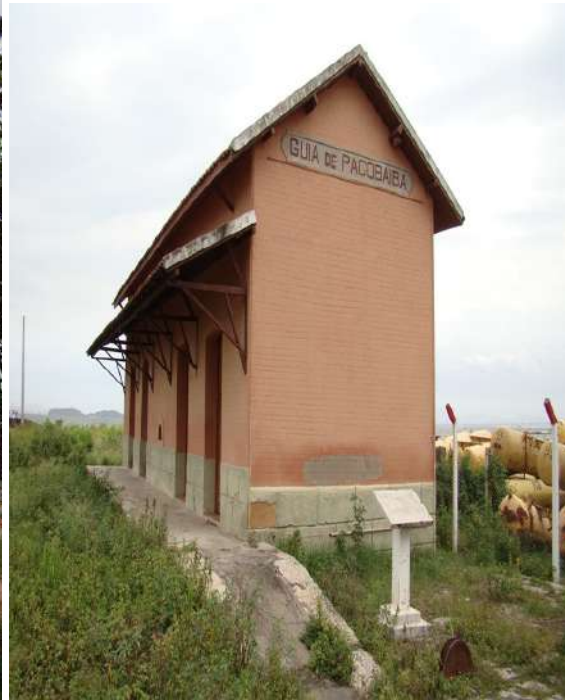
3- Construção modificada dentro do canteiro de obras 4 - Estação remanescente