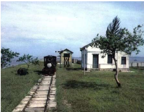
1 Anos 70- Patrimônio ainda preservado

O terreno em que as obras da PETROBRAS na Praia de Mauá são realizadas está situado na área em que foi estabelecida a primeira ferrovia no Brasil em 1854. A ferrovia fazia a ligação entre a Baía de Guanabara e a cidade de Petrópolis e é tombada pelo Instituto do Patrimônio Histórico e Artístico Nacional (Iphan). A manutenção da infraestrutura remanescente é de responsabilidade do IPHAN, mas com a presença das obras da PETROBRAS esse patrimônio está ainda mais ameaçado, tendo, inclusive, uma de suas construções alteradas e situada na parte interna do canteiro de obras. (foto 3) Em 2007 o Ministério Público Federal em São Gonçalo (RJ) entrou com ação civil pública, contra o município de Magé e o Iphan para que a área fosse preservada.