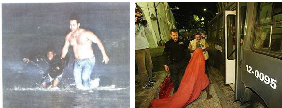
(Operações de recolhimento na Zona Sul e na Lapa)

Carnaval. A operação foi feita de madrugada, quando os policiais bateram, expulsaram e ameaçaram os meninos/as que lá dormiam, inclusive de morte. Casos como estes são mencionados também na Zona Sul e São Cristóvão, que recolhem de forma truculenta os meninos/as e queimam seus pertences. Outra grave denúncia é que existem casos de bebês que são apartados de suas mães.