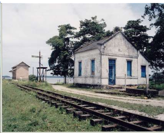
2 - Antes da instalação da PETROBRAS